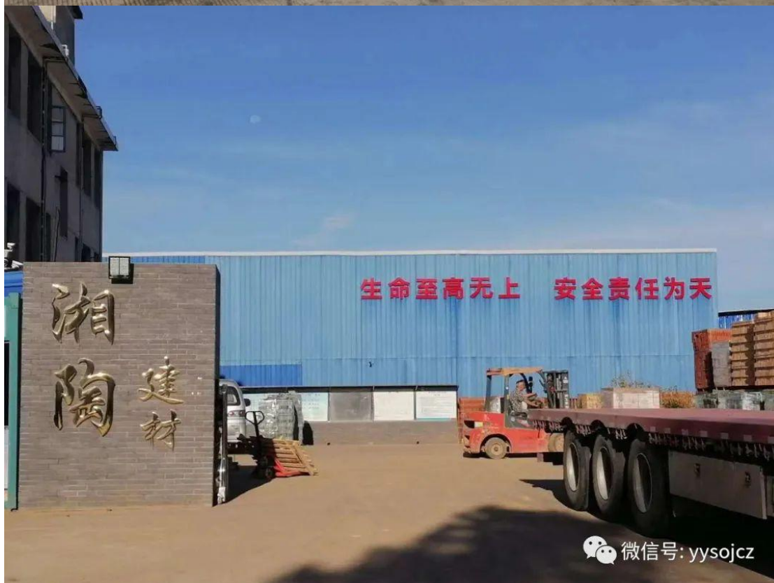
欧江岔镇工业经济发展迅速，以生产建材、铸造、制衣等为主。三木制衣、科发纸业、迎松食品、上湖机械等企业运行平稳，湘陶建材、建胜建